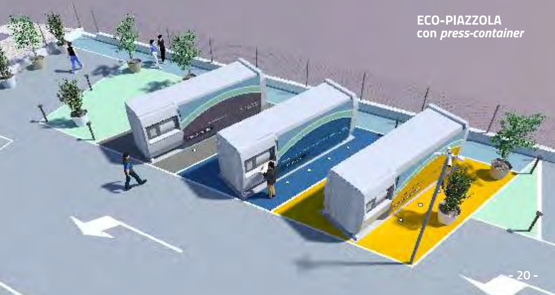
ECO-PIAZZOLA con press-container

Le eco-piazzole avranno una superficie di circa 250-300 metri quadri ciascuna per la collocazione delle diverse attrezzature per la raccolta differenziata. In aggiunta ai press-container sono stati predisposti ulteriori contenitori per altre tipologie di rifiuti . Consulta l' App Junker o il sito ambientespa.net per informazioni.